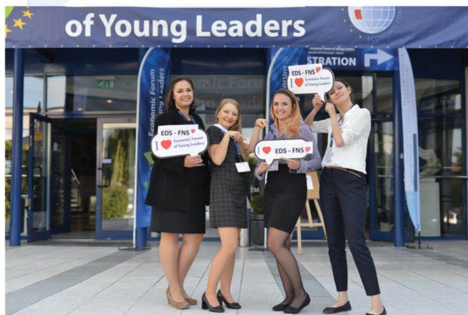
Inkubator współpracy polsko-czeskiej

W swoich działaniach Fundacja kieruje się wartościami chrześcijańskimi. Poprzez edukację wszystkich pokoleń wzmacnia idee demokracji, samorządności, społecznej gospodarki rynkowej, solidarności między narodami oraz porozumienia kultur ponad wszelkimi granicami.